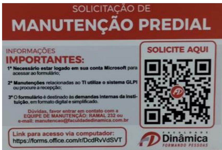
Figura 02 – Placas de orientação sobre o processo de abertura de chamados para manutenção predial